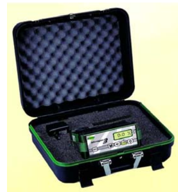
Equipo Microgas 3 SA